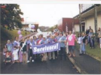
写真 (上)RFLスタート・国旗、 州旗掲揚 (下)サバイバーズラップ

…3月10日午後6時から開催されるハワイ大学ヒロ校11周年RFLに参加するため、1時間前に到着しました。宿泊先からヒロ校までは10分程度です。