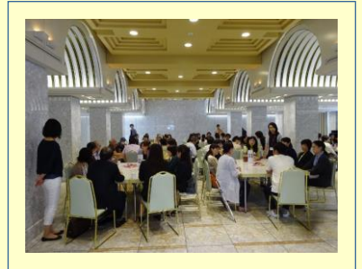
短時間ではありましたが、お茶を飲みながら楽しい時間を過ごしました。